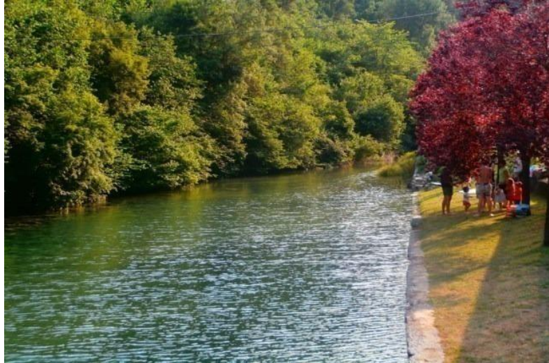
Mota: Ibaia | Kokapena: Uztarroze

Uztarrozeko ibai igerilekua Pirinioetako Uztarroze herrian dago, Erronkaribarren. Uztailean, egurrezko oholak jartzen dira zubiaren ondoan, zeharka, ura biltzeko eta, horrela, bainurako behar den sakonera edukitzeko. Urak hotzak dira, eta udan 14 eta 17º C arteko tenperatura izaten dute.