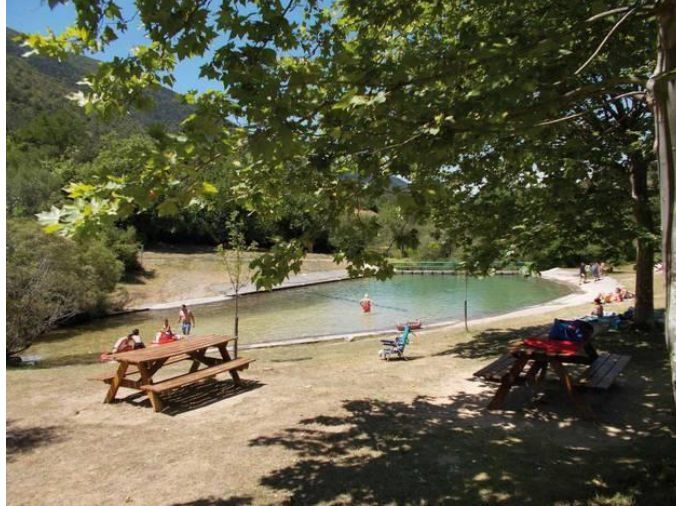
Mota: Ibaia | Kokapena: Nabaskoze

Benasako arroilaren ibai igerilekua naturaz inguratutako paraje batean dago, eta bere balioengatik Batasuneko garrantzizko leku (BGL) izendatu dute. Pirinioetan egon arren, Mediterraneoko baldintza klimatikoak ditu, eta, beraz, izeiak eta arteak batzen dira paisaian. Urak Benasa errekatik datoz eta, uhate baten bidez, hormigoizko igerileku batean biltzen dira. Eremuan uraren kalitate kontrolak egiten dira 1994az geroztik.