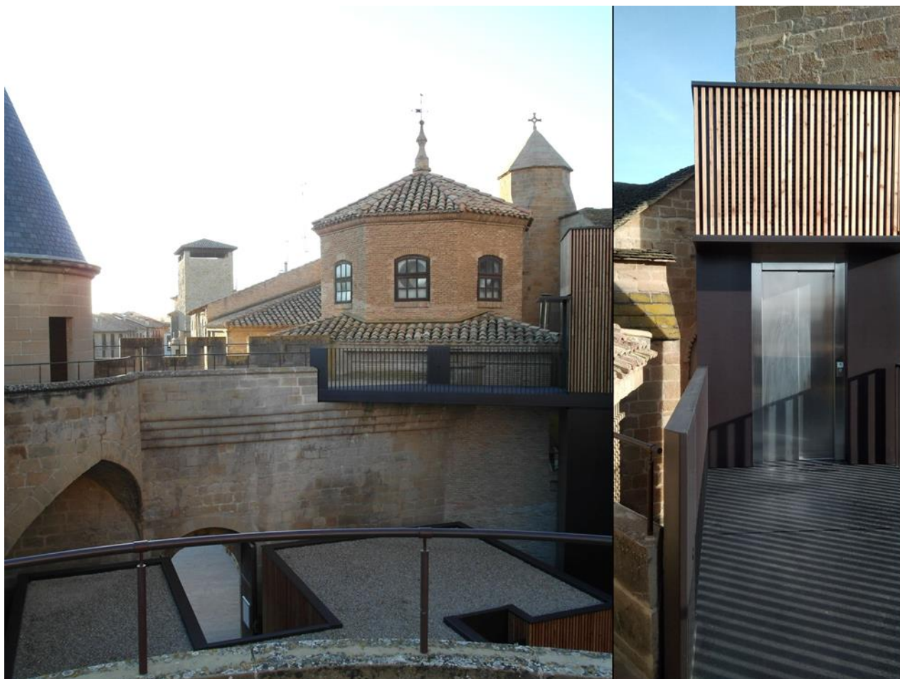
Ascensor en el Palacio de Olite

Señalización, que debe estar presente en: