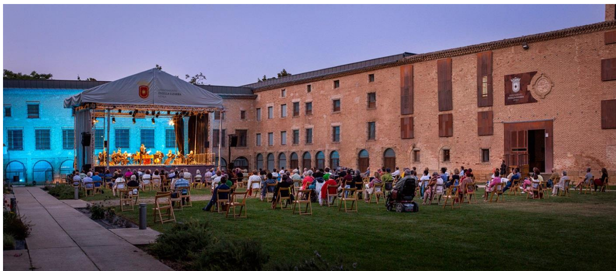
Semana de la Música Antigua de Estella

Esta guía se pretende que sea muy práctica y fácil de aplicar. Se divide en un apartado centrado en accesibilidad física, otro en accesibilidad sensorial y otro en accesibilidad cognitiva. A esto se añade un capítulo de buenas prácticas, recursos online de consulta y un glosario de términos. Para finalizar, se encuentran los anexos, donde se presenta una serie de fichas resumen con la normativa que afecta.