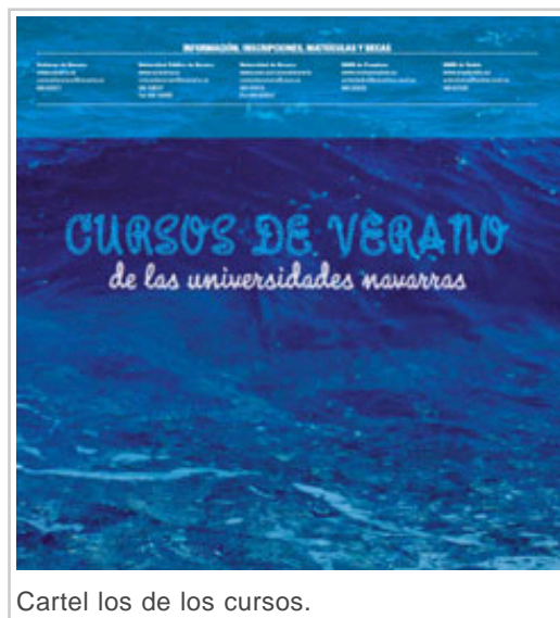
Cartel los de los cursos.

La UNED de Pamplona ha preparado cinco actividades formativas: “Un recorrido histórico por el Palacio Real (de Olite) a través de sus personajes”, para el 18 y 19 de julio; “Conocer la caracterización de los personajes y escenografía en ‘El nombre de la rosa’”, el 20 de julio; “Las fronteras de un reino”, del