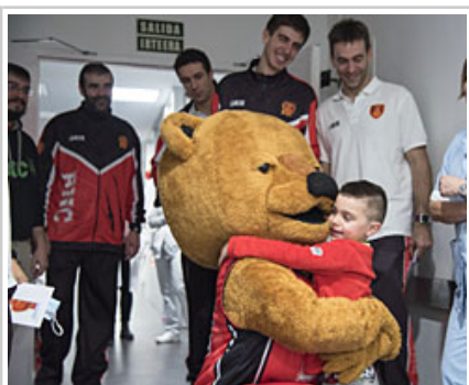
La mascota del club con un niño.