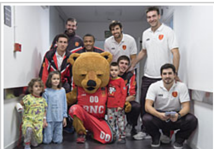
imagen captada en el pasillo con la, pacientes, mascota y personal de CHN.