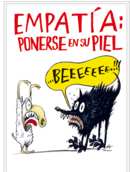
Cartel de la exposición: empatía.