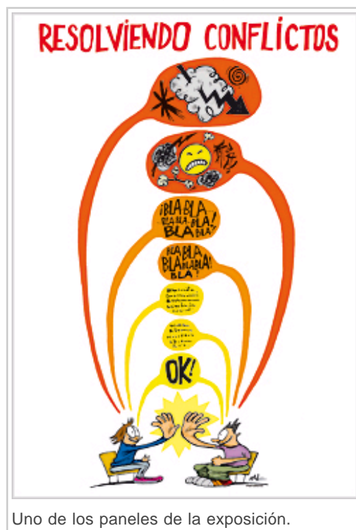
Uno de los paneles de la exposición.

Este curso se incidirá en la convivencia y la resolución dialogada de los conflictos. Para ello, se han elaborados seis paneles, tanto en euskera como en castellano, titulados el conflicto existe en nuestras vidas, tú decides cómo afrontarlo, somos iguales somos diferentes, empatía: ponerse en su piel, hablando y escuchando, y resolviendo conflictos.