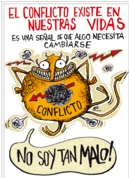
Cartel de la exposición: la existencia de conflictos.