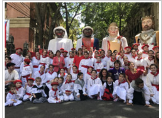
La delegación navarra posa con dantzaris de los centros navarros en Argentina.

La Presidenta de Navarra, Uxue Barkos, ha protagonizado diversos actos protocolarios en Rosario con los que ha concluido su viaje institucional a Argentina, durante el que ha mantenido reuniones con autoridades de las dos ciudades que ha visitado, la capital del país, Buenos Aires, y Rosario, se ha reunido con representantes del mundo empresarial argentino y ha participado en los encuentros de la colectividad navarra celebrados en ambas ciudades.