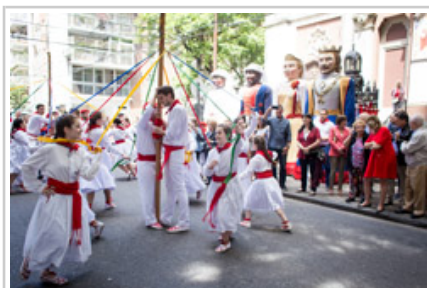
Actuación en las calles de Rosario.