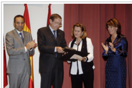
Momento de la entrega del galardón.