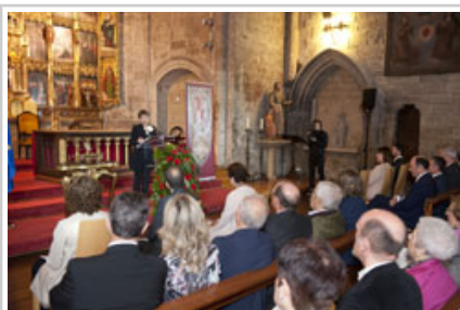
La Presidenta Uxue Barkos se dirige a los asistentes.