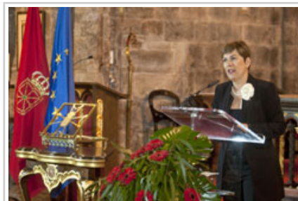
La Presidenta Barkos se dirige a los asistentes al acto.