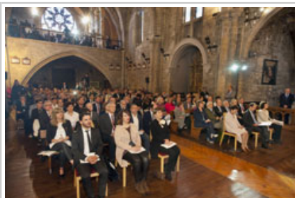
Autoridades e integrantes del Gobierno en el acto.