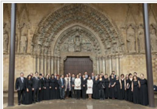
Los miembros de la Coral posan con las autoridades ante la puerta de la iglesia.

El acto se ha iniciado a las 11 horas, con la presencia de los galardonados, las consejeras y los consejeros del Gobierno de Navarra, las principales autoridades de la Comunidad Foral, y las y los integrantes del Consejo Navarro de Cultura. Debido a la meteorología la ceremonia se ha desarrollado en