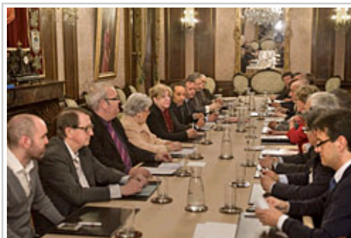
Reunión del Consejo Navarro de Cultura para la propuesta de candidato al Premio Príncipe de Viana 2013.