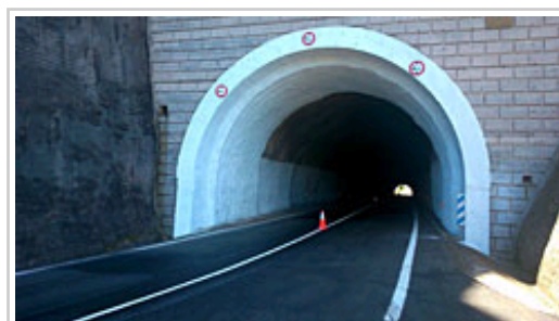
Los hastiales del túnel de Lizarraga han sido pintados de blanco para mejorar la visibilidad en su interior.

Dada la estrechez de la pista por la que discurrirá el final de la etapa, el Gobierno de Navarra recuerda a los ciudadanos que presencien