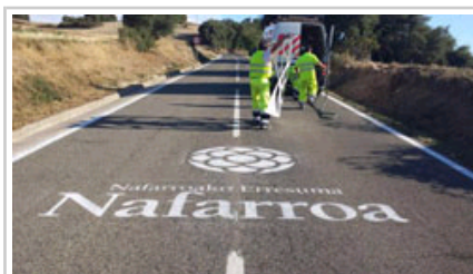
El logotipo turístico de Navarra ha sido rotulado en diversas carreteras en castellano, euskera y francés.