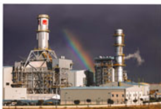
"Nuevas energías", de Eduardo Blanco Mendizábal, segundo premio.