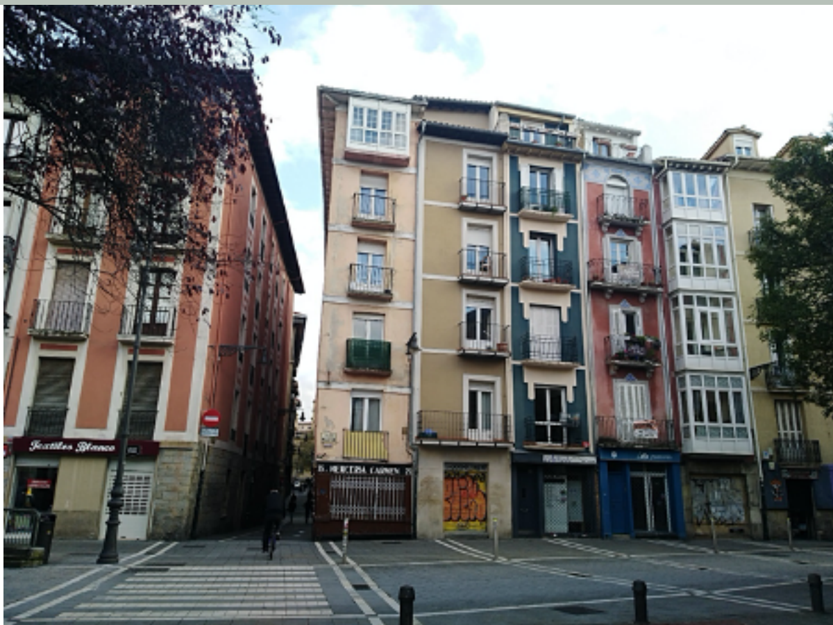
Calle Nueva, a la altura de la Plaza de San Francisco. Casas con la típica estructura medieval de fachada estrecha y planta en profundidad