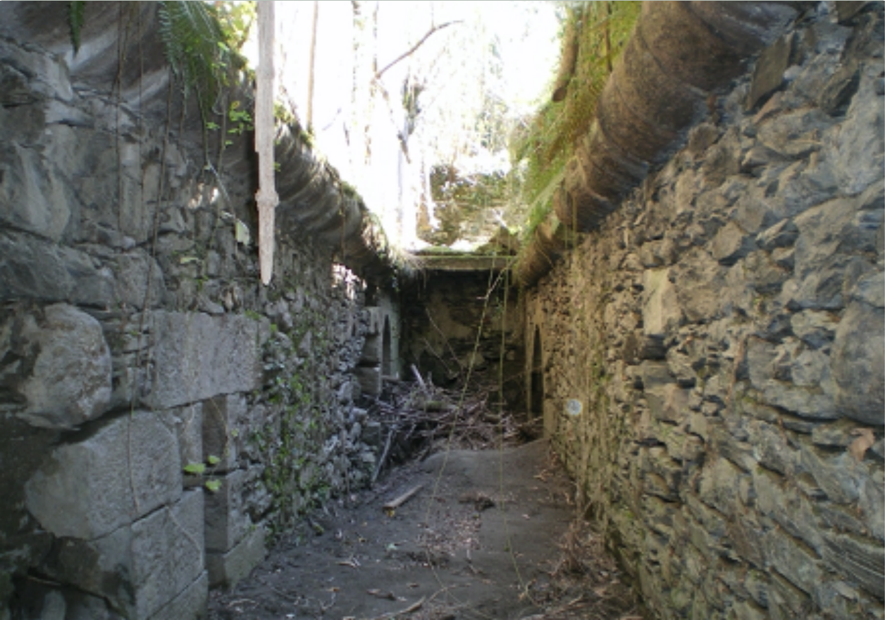
Foto del estado actual de las ruinas de la ferrería de Etxalarlasa. Piso inferior.