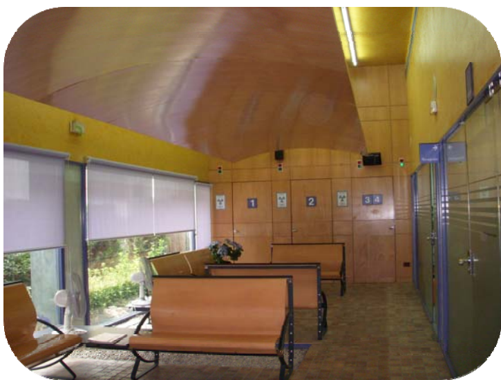
Sala de espera para la realización de mamografías

Instituto de Salud Pública y Laboral de Navarra