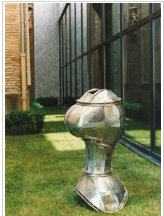
Una de las obras de la artista.

Dora Salazar (Alsasua, 1963) es una artista plástica formada en la facultad de Bellas Artes de la Universidad del País Vasco. Desde que en 1985 realizó sus primeras exposiciones, su presencia ha sido constante en colecciones privadas y públicas. A través del collage y el reciclaje busca plasmar su interpretación del cuerpo humano en dibujos,