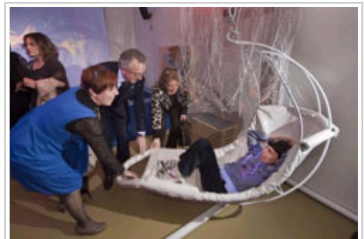
Centro de Atención a la Discapacidad Las Hayas. El Presidente Sanz juega con un residente.

El Presidente de Navarra, Miguel Sanz Sesma, ha inaugurado esta mañana el Centro de Atención Integral a Discapacidad Las Hayas, en la localidad de Sarriguren (Valle de Egüés). El centro tiene capacidad para 60 plazas residenciales, de las que 10 son para grandes asistidos y 10 para residentes con complejidad conductual, y otras 20 como centro de día.