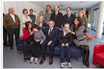
Centro de Atención a la Discapacidad Las Hayas. Las autoridades con algunos residentes y profesionales.