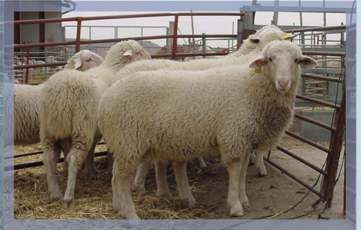
Ovino de raza Navarra (especialización: carne)