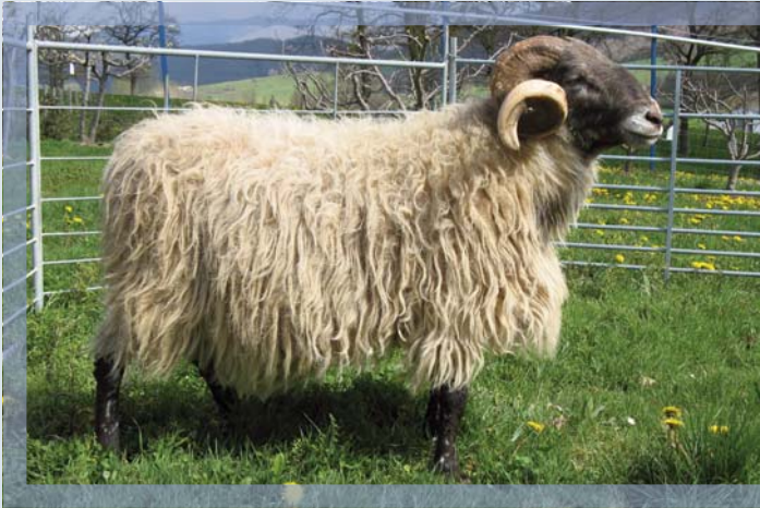
Ovino de raza Latxa (especialización: leche)