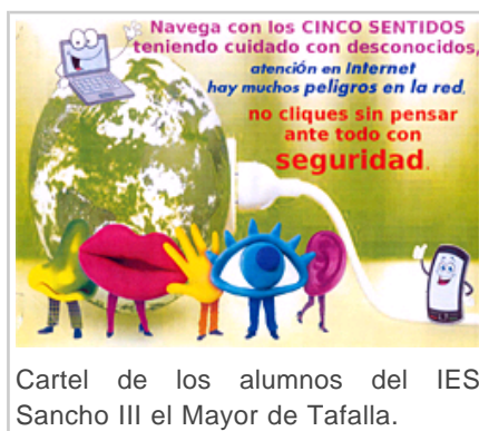
Cartel de los alumnos del IES Sancho III el Mayor de Tafalla.