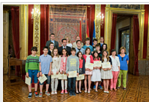
Los alumnos premiados junto con el consejero Alli, sus profesores y otras autoridades.

El consejero de Políticas Sociales, Íñigo Alli, ha entregado esta mañana en el Salón del Trono del Palacio de Navarra unos diplomas acreditativos a los quince alumnos del colegio público Santa Bárbara de Monreal, del instituto Sancho III el Mayor de Tafalla y del instituto Biurdana de Pamplona que han ganado la fase autonómica del concurso Consumópolis .