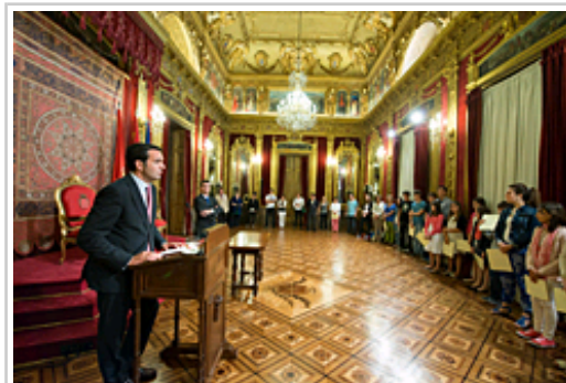
El consejero Alli se dirige a los presentes en el acto.