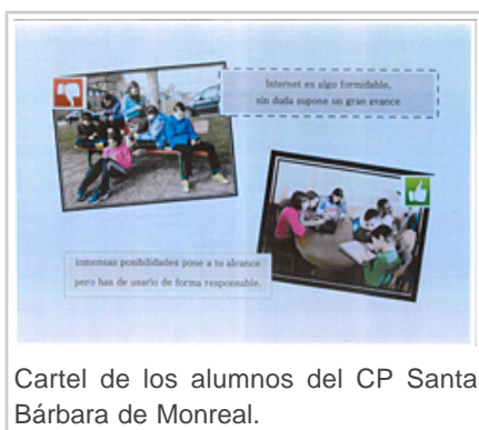
Cartel de los alumnos del CP Santa Bárbara de Monreal.