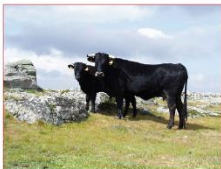
El Ministerio de Agricultura, Pesca y Alimentación ha publicado el miércoles 1 de marzo los tipos de ayudas directas de la Política Agrícola Común (PAC) que podrán solicitar unos 650.000 agricultores españoles hasta el 31 de mayo, con un presupuesto de 4.875 millones de euros.

El Ministerio de Agricultura, Pesca y Alimentación ha publicado el miércoles 1 de marzo los tipos de ayudas directas de la Política Agrícola Común (PAC) que podrán solicitar unos 650.000 agricultores españoles hasta el 31 de mayo, con un presupuesto de 4.875 millones de euros. Del 1 de marzo al 31 de mayo se abre el plazo para la "solicitud única" de las subvenciones directas de la PAC, que en 2023 tiene como novedad la aplicación de la reforma más ambiciosa de la Unión Europea (UE) desde el punto de vista medioambiental. España tenía un presupuesto de 47.724 millones de euros para la nueva PAC, de los cuales 10.730 millones se otorgaron en el periodo transitorio hasta su entrada en vigor (2021-2022) y 32.549 millones van a las medidas del Plan Estratégico Nacional para aplicar la nueva PAC en es-