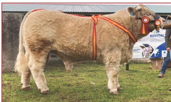
La Asociación Nacional de Charolés licitará 14 sementales y celebrará un Concurso Morfológico (en la imagen, campeón 2021), UCHAE subastará 5 sementales y hará su Concurso Morfológico