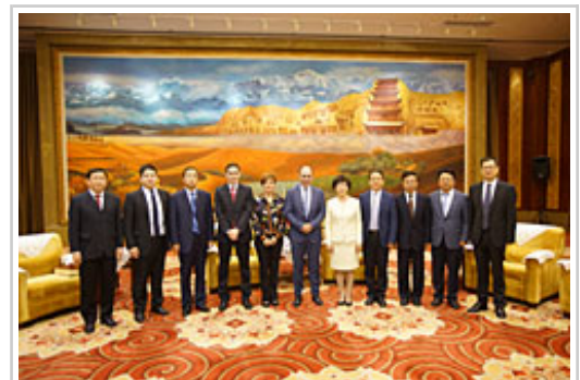
Delegaciones de ambas administraciones, tras la firma del acuerdo.