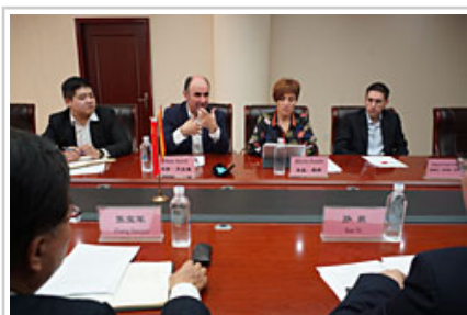
El vicepresidente Ayerdi mantiene una apertada agenda de trabajo en la provincia china de Gansu