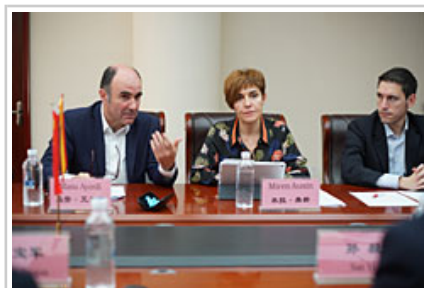
Intervención en una reunión del vicepresidente Ayerdi.