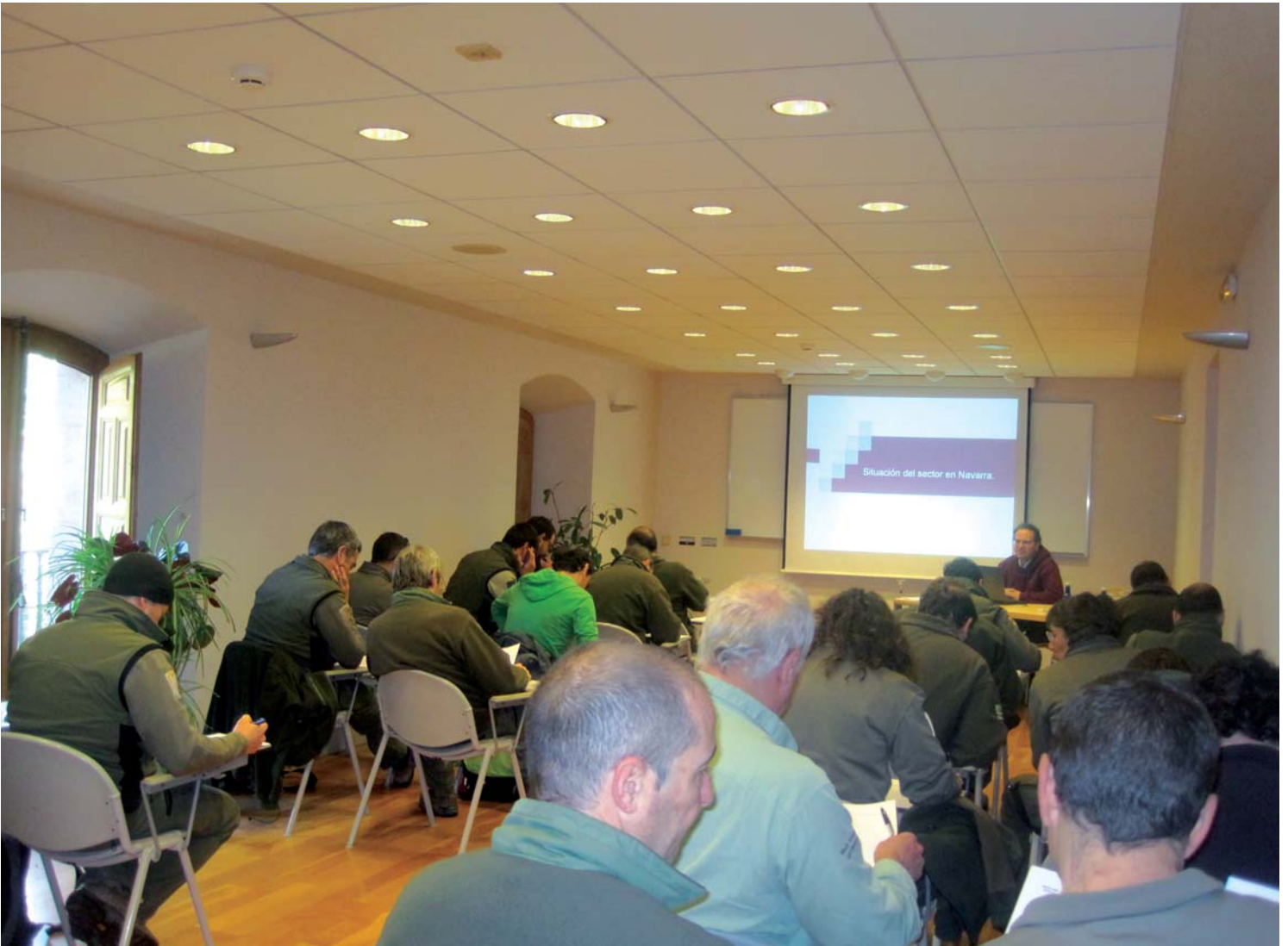
CURSO FORMATIVO SOBRE PREVENCIÓN DE RIESGOS LABORALES EN BERTIZ