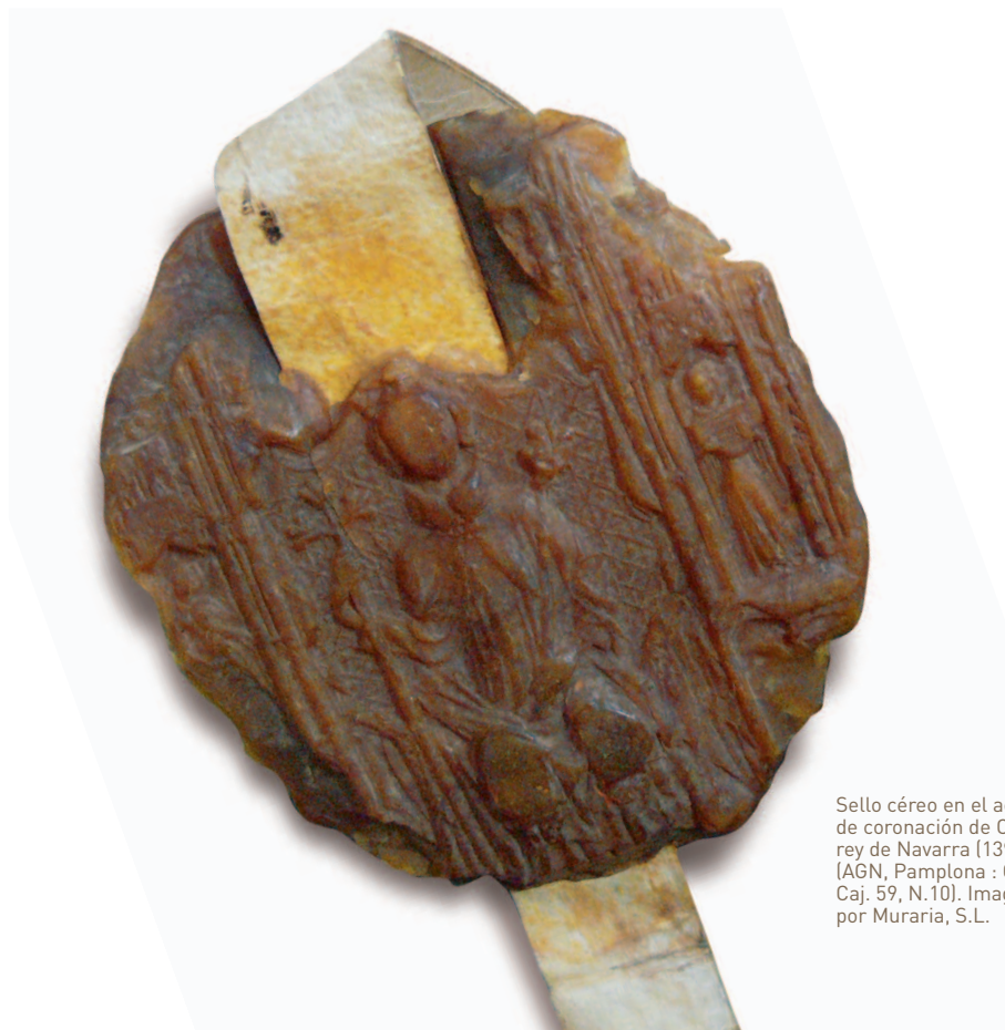
Sello céreo en el acta de coronación de Carlos III, rey de Navarra (1390) [AGN, Pamplona : CO Doc., Caj. 59, N.10].