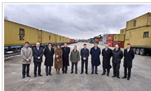
La Presidenta Barcina y el consejero Zarraluqui, con el resto de autoridades, en la Terminal Intermodal de Noáin.

La Presidenta de Navarra, Yolanda Barcina, ha presidido hoy el acto inaugural de la Terminal Intermodal de Noáin (TIN), un centro logístico de mercancías que desde el pasado mes de octubre está conectado por tren con la terminal de contenedores BEST (Barcelona Europe South Terminal) del puerto de Barcelona, considerada una de las terminales marítimas más modernas y eficientes de Europa.