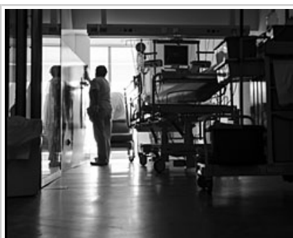
La exposición forma parte de la estrategia de humanización que lleva a cabo Salud.