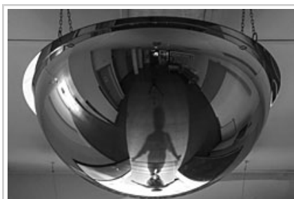
Han quedado registrados para la posteridad momentos puntuales o curiosos durante el turno de noche.