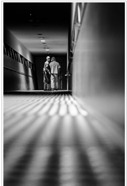
La exposición recrea escenas del trabajo de noche en CHN.