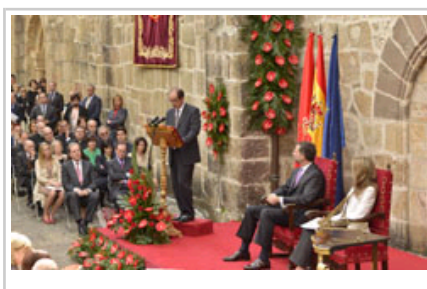
El galardonado durante su discurso