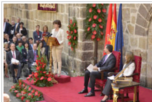
La presidenta dirige su alocución a los asistentes.

Así, ha subrayado que “la política tiene que hacerse de otra manera, con otro estilo y otras prioridades”, insitiendo en que “no estamos solo ante problemas de gobernabilidad sino en medio del agotamiento de una cierta cultura política”. Según ha señalado, la ciudadanía requiere que los sacrificios