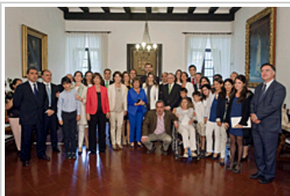
SS.AA.RR. los Príncipes y el galardonado, con familiares del filósofo que han acudido al acto de entrega.