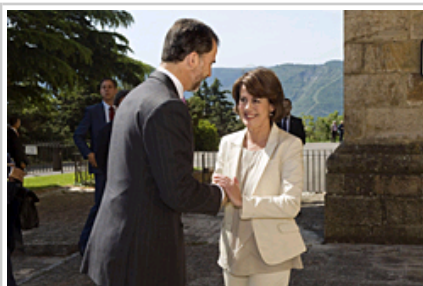
La Presidenta Barcina recibe a Sus Altezas Reales.