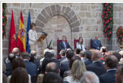
La Presidenta durante su alocución.