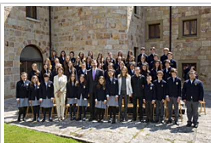
Escolanía del Orfeón Pamplonés.