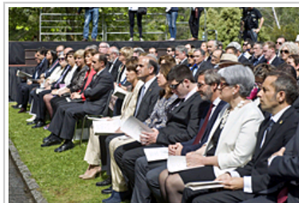
Autoridades de la Comunidad Foral.