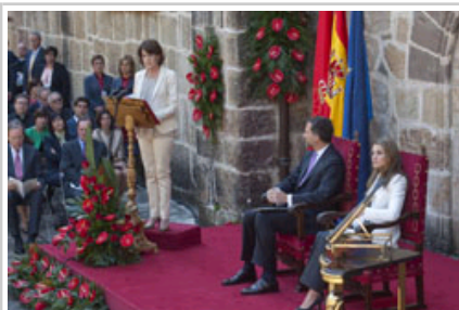
La Presidenta Barcina durante su alocución.