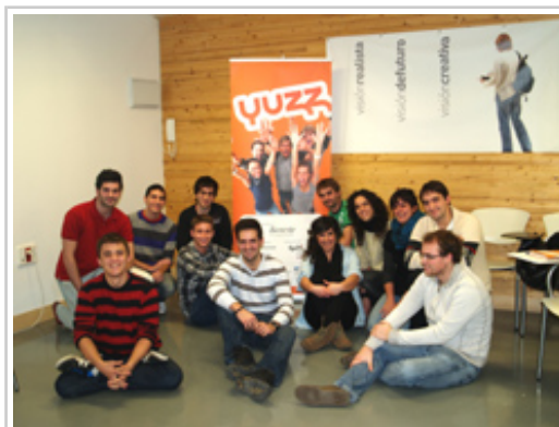
Participantes de la fase navarra del programa Yuzz.

El programa Yuzz se dirige a jóvenes de entre 18 y 30 años que desean desarrollar sus ideas de base tecnológica, o relacionados con las tecnologías de la información y la comunicación, y se configura como un programa de reconocimiento de proyectos y del talento emprendedor y las habilidades y capacidades de los participantes.