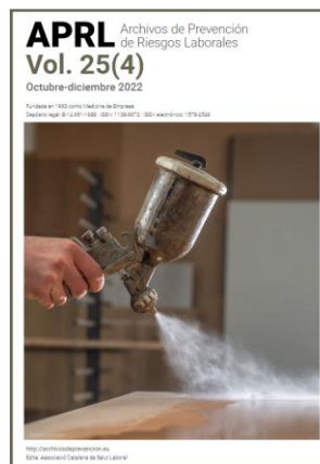
Archivos de Prevención de Riesgos Laborales (Vol. 25) APRL

Nafarroako Osasun Publikoaren eta Lan Osasunaren Institutuak (NOPLOI) ez du bere gain hartzen argitaraturiko artikuluen eta albisteen edukirik; izan ere, bere horretan hartu dira kasuan kasuan aipaturiko webgunetik, eta ez zaie aldaketarik egin ezta deus erantsi ere. Edozein kontsulta edo iradokizun egin nahi baduzu, edo ez baduzu bidaltzaile honen informazio gehiago jaso nahi, NOPLOIra jo dezakezu, helbide elektronikoa honetara ispln.ufii@navarra.es