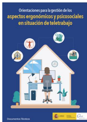
Orientaciones para la gestión de los aspectos ergonómicos y psicosociales en situación de teletrabajo INSST