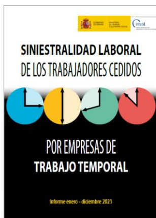
Siniestralidad laboral de los trabajadores cedidos por empresas de trabajo temporal INSST