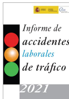
Informe de accidentes laborales de tráfico 2021 OIT