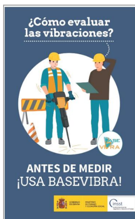
¿Cómo evaluar las vibraciones? Antes de medir ¡Usa basevibra! INSST