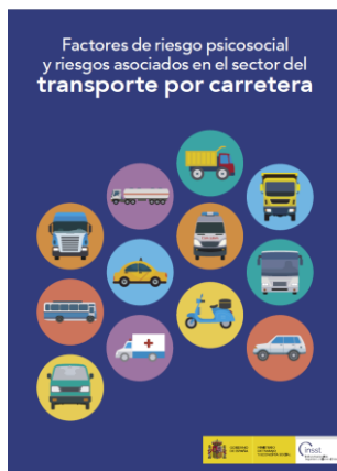
Factores de riesgo psicosocial y riesgos asociados en el sector del transporte por carretera