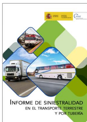
Informe de siniestralidad en el transporte terrestre y por tubería