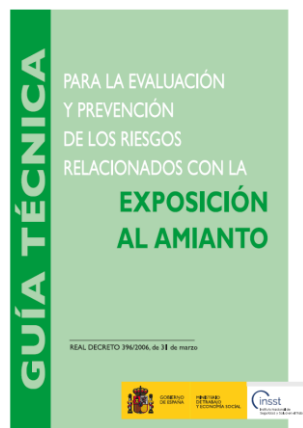
Guía técnica para la evaluación y prevención de los riesgos relacionados con la exposición al amianto - Año 2022