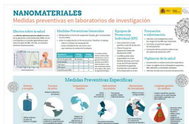
NANOMATERIALES. Medidas preventivas en laboratorios de investigación