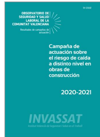
Campaña de actuación sobre el riesgo de caída a distinto nivel en obras de construcción INVASSAT