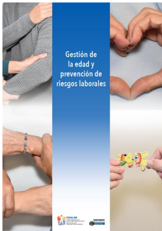
Gestión de la edad y prevención de riesgos laborales OSALAN