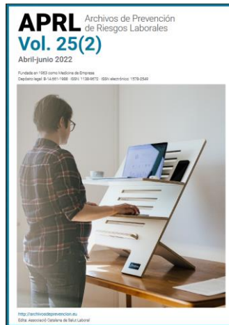
Archivos de Prevención de Riesgos Laborales Revista APRL