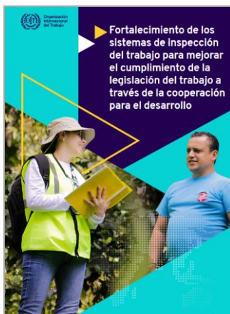
Fortalecimiento de los sistemas de inspección del trabajo OIT