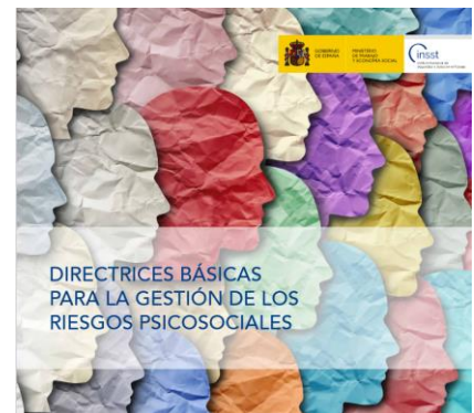
Directrices Básicas para la gestión de los riesgos psicosociales INSST

Nafarroako Osasun Publikoaren eta Lan Osasunaren Institutuak (NOPLOI) ez du bere gain hartzen argitaraturiko artikuluen eta albisteen edukirik; izan ere, bere horretan hartu dira kasuan kasuan aipaturiko webgunetik, eta ez zaie aldaketarik egin ezta deus erantsi ere. Edozein kontsulta edo iradokizun egin nahi baduzu, edo ez baduzu bidaltzaile honen informazio gehiago jaso nahi, NOPLOIra jo dezakezu, helbide elektroniko honetara: ispln.ufii@navarra.es