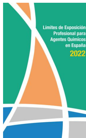
Límites de exposición profesional para agentes químicos en España INSST