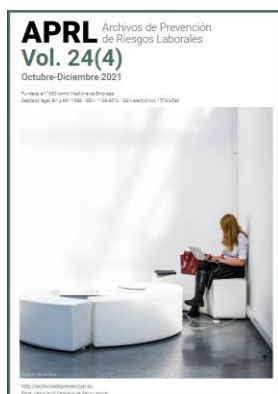
Archivos de prevención de Riesgos Laborales (Vol.24) APRL