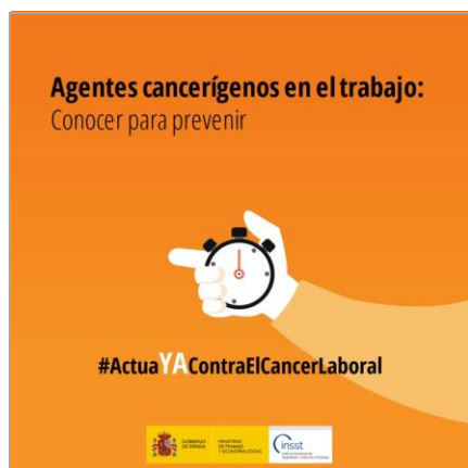
Agentes cancerígenos en el trabajo. Conocer para prevenir INSST