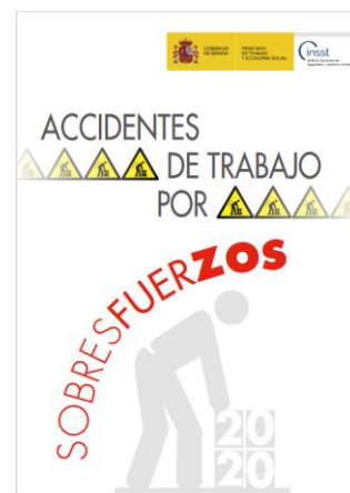
Accidentes de trabajo por sobreesfuerzos INSST