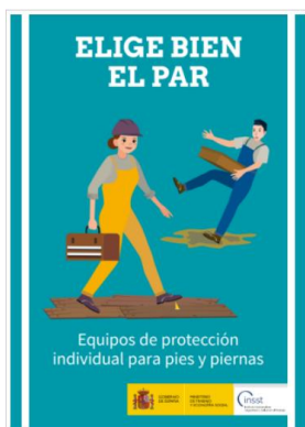
Elige bien el par. EPI para pies y piernas INSST