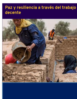
Paz y resiliencia a través del trabajo decente OIT