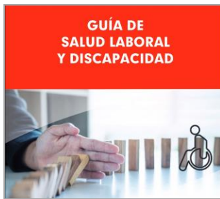
Salud laboral y discapacidad CCOO