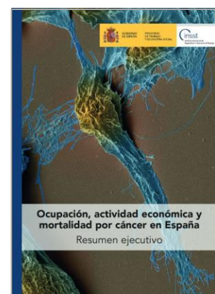
Ocupación, actividad económica y mortalidad por cáncer en España: Resumen ejecutivo INSST