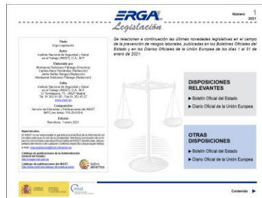
Erga Legislación INSST