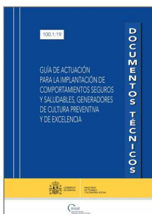
Guía de actuación para la implantación de comportamientos seguros y saludables, generadores de cultura preventiva y de excelencia INSST