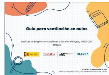
Ventilación en las aulas para la prevención del COVID-19 CSIC - IDAE

El Instituto de Salud Pública y Laboral de Navarra (ISPLN) no se hace responsable de los contenidos de los artículos y noticias publicadas, las cuales han sido obtenidas tal y como aparecen en sus correspondientes páginas web, sin modificaciones ni añadidos, citando su procedencia. Si desea realizar cualquier consulta, sugerencia o no quiere recibir más información de este remitente, puede contactar con el ISPLN en el correo electrónico ispln.ufii@navarra.es