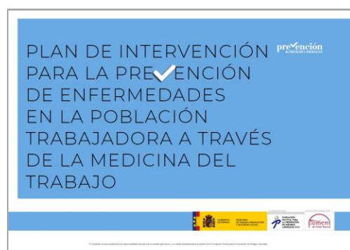
Plan de intervención para la prevención de enfermedades en la población trabajadora a través de la medicina del trabajo FOMENT DEL TREBALL