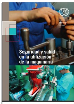
Recomendaciones sobre seguridad y Salud en la utilización de maquinaria OIT