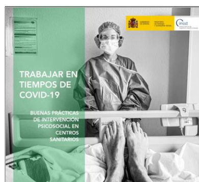
Trabajar en tiempos de COVID. Buenas prácticas de intervención psicosocial en centros sanitarios INSST