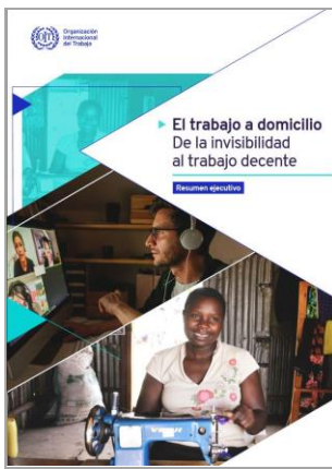
El trabajo a domicilio: De la invisibilidad al trabajo decente OIT