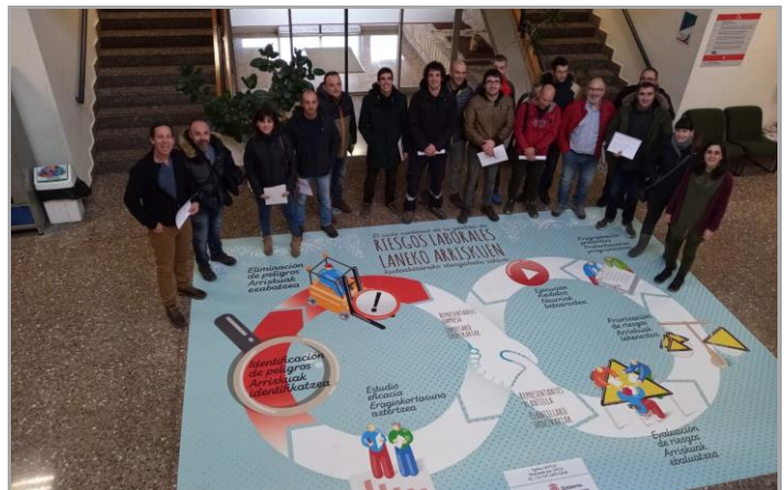
Participantes en un taller, en la sede del ISPLN en Landaben.