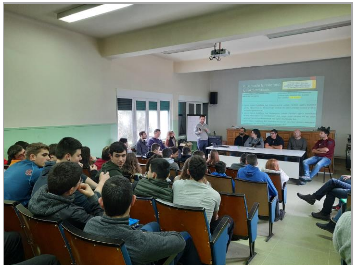
Un momento de la jornada sobre prevención.

Formación sobre prevención en Elizondo Lanbide Eskola. Un técnico del Instituto de Salud Pública y Laboral de Navarra (ISPLN-NOPLOI) participó el pasado 17 de enero en la impartición de una jornada de prevención de riesgos laborales celebrada en Elizondo Lanbide Eskola. Asistieron más de 50 personas , entre estudiantes y docentes. Como ponentes, en la jornada también participaron representantes sindicales y dos trabajadores que, en su día, sufrieron accidentes graves. Esta iniciativa se enmarca dentro de los contenidos de la asignatura sobre Formación y Orientación Laboral (FOL).