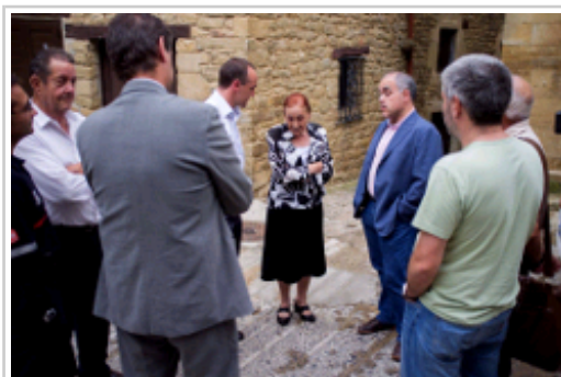
El consejero Esparza y el director de la ANE conversan con la alcaldesa de Ujué en las calles del pueblo.

Respecto a los pinares, se mantendrán sobre el terreno aquellos pies de pino alepo con una afección menor al 50% de su copa con el objetivo de buscar su regeneración natural. En caso de no existir árboles capaces de regenerar, se procederá a la restauración total del terreno afectado, presumiblemente en el año 2013, con la misma especie o con otras, siempre en consenso con el Ayuntamiento de Ujué.