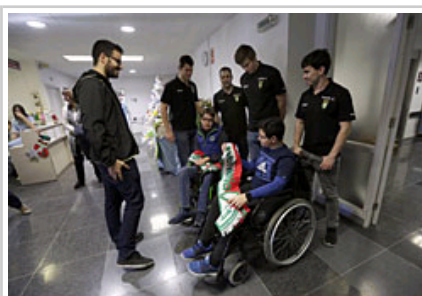
Los deportistas entregan material deportivo.