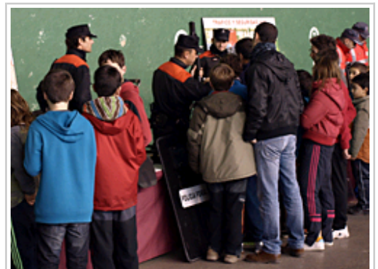
Agentes de Seguridad Ciudadana de Policía Foral, durante la demostración en Los Arcos.