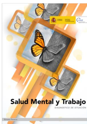
Salud Mental y Trabajo INSST