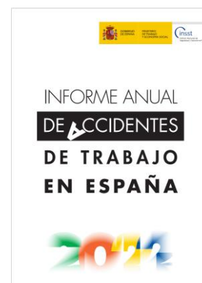
Informe anual de accidentes de trabajo en España INSST