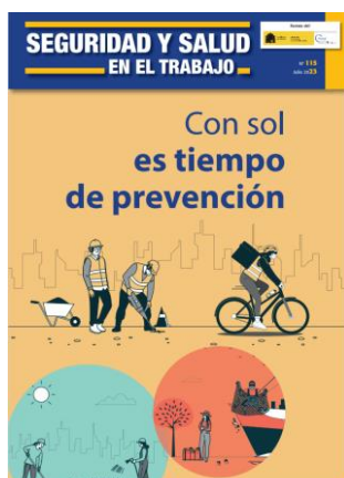
Revista Seguridad y Salud en el Trabajo (Nº 115) INSST