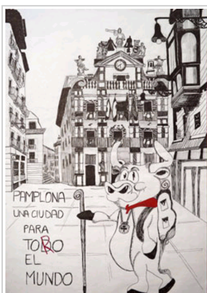
Primer premio en la categoría de 1º y 2º de ESO.