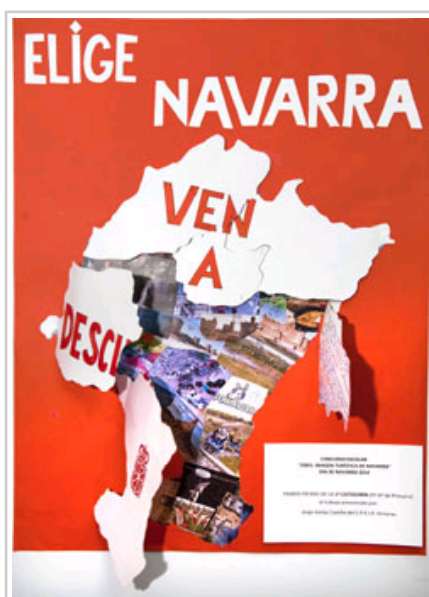
Primer premio en la categoría de 5º y 6º de Primaria.