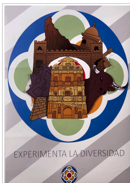
Primer premio en la categoría de Bachillerato.