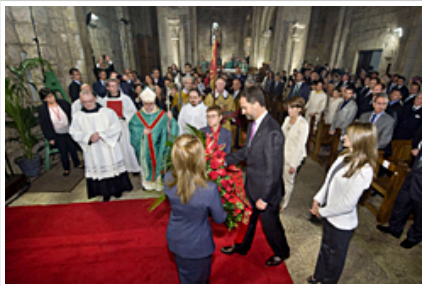
Don Felipe porta una corona de flores rojas.