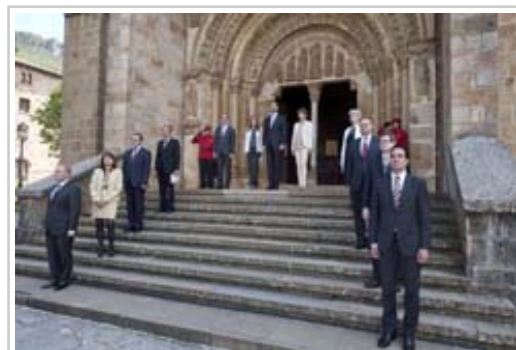
Cortejo formado a la entrada del templo.

Finalizados los actos en Leyre, los Príncipes de Asturias y de Viana y demás autoridades se han trasladado hasta el restaurante Castillo de Gorraiz (Valle de Egüés), donde ha tenido lugar el almuerzo. El menú ha consistido en espárragos y alcachofas de Tudela, solomillo de ternera de Navarra o rape a la parrilla y cuajada de la Ultzama de postre, todo ello con vinos de la Denominación de Origen Navarra.