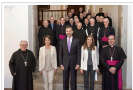
Los Príncipes y la Presidenta Barcina posan junto a la comunidad