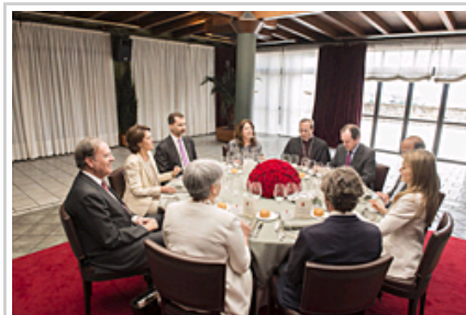
Sus Altezas Reales, la Presidenta Barcina y autoridades, durante el almuerzo.