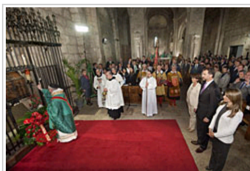
Corona de flores rojas ante el sepulcro de los Reyes de Navarra, ofrecida por D. Felipe.