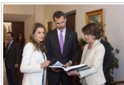
Sus Altezas Reales reciben de manos de la Presidenta como regalo