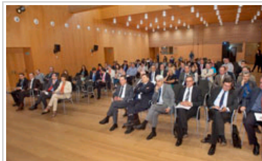
Parte de los asistentes a la sesión.

La Presidenta ha afirmado que la colaboración entre estas cuatro universidades pretende ofrecer una formación de "calidad", una investigación "competitiva, multidisciplinar e innovadora" y una aplicación "eficiente" en el sector productivo, agrupando a los investigadores, centros tecnológicos, parques científicos y empresas de cuatro regiones española. "De este modo, se logrará reforzar la posición internacional de nuestras comunidades y universidades", ha destacado.