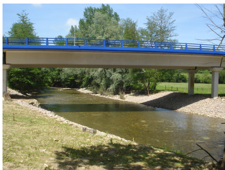
Viaducto río Baztán