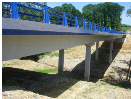
Viaducto 3 Regata Tellebiko.