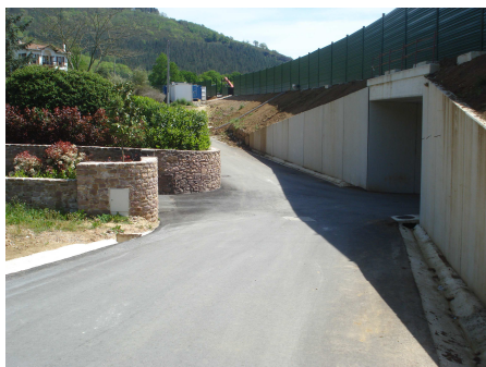
Paso inferior 3