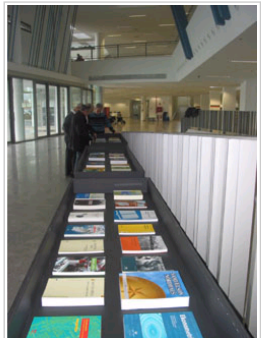
Imagen de la exposición.

EIRE acaba de firmar un convenio con el Servicio de Bibliotecas de Navarra para que una colección de libros universitarios en euskera permanezca físicamente en la Biblioteca de Navarra, abierta a alumnos, profesores y sociedad en general. Para dar la máxima difusión a la incorporación de la colección, se ha organizado esta exposición que consta de aproximadamente 150 ejemplares, escogidos de entre la colección completa que asciende a 619 libros. Los libros incluyen casi todas las áreas de conocimiento y las áreas científicas, correspondiendo aproximadamente un 40% a las Humanidades, un 29% a las Ciencias Sociales, un 11 % a Ciencias de la Salud, y un 10% respectivamente a las Ciencias Técnicas y Tecnología, y a las Ciencias Naturales. Una vez finalizada la exposición, la colección de libros universitarios en euskera, propiedad de EIRE, estará disponible de manera permanente en la Biblioteca de Navarra, en estanterías de libre acceso de la planta 2 detrás del fondo de Navarra.