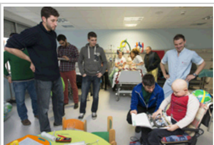
Los jugadores del Helvetia Anaitasuna departen con niños ingresados en el CHN.