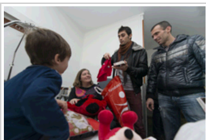
Dos jugadores de Osasuna entregan un regalo a una niña hospitalizada.