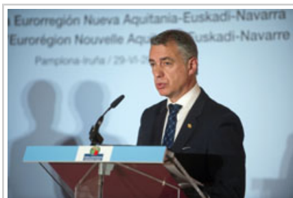
Discurso del Presidente Urkullu.