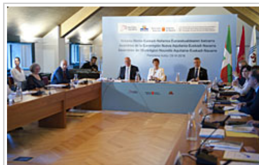
Los tres presidentes durante la asamblea.

El análisis efectuado sigue manteniendo como objetivos estratégicos los ejes previstos inicialmente: ciudadanía eurorregional, área de economía del conocimiento, innovación y competitividad empresarial, y territorio y movilidad sostenible. Garantizar la gobernanza y la coordinación de los diferentes proyectos y acciones incluidos en el plan es el cuarto eje, papel que recae en la propia AEET. Cada uno de estos objetivos, se concreta en diversas líneas de actuación y acciones. En total, se han definido 14 líneas de actuación y 36 acciones.