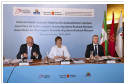
Los representantes de las tres regiones, en un momento de la sesión.