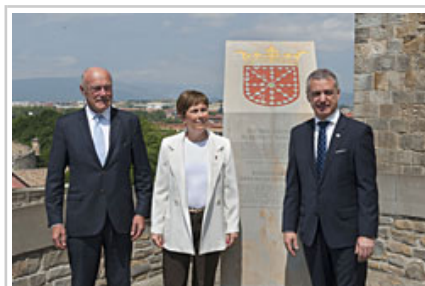
El Presidente Alain Rousset, la Presidenta Barkos y el Lehendakari Iñigo Urkullu.