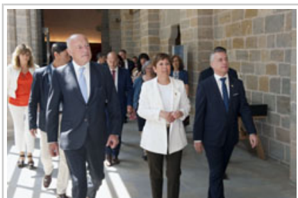
Los tres presidentes, en el Archivo de Navarra, donde ha tenido lugar la asamblea.