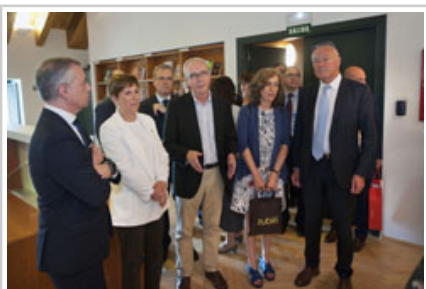
Las autoridades visitan el Archivo de Navarra.