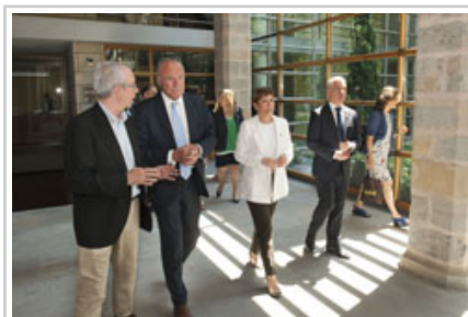
Las autoridades, a su salida del Archivo de Navarra.