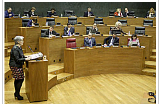
Otro momento de la intervención de la vicepresidenta Goicoechea en el Parlamento.

● En primer lugar, Goicoechea ha hecho referencia a la nueva política fiscal “que favorece la instalación de nuevas empresas” y que, además de un nuevo Impuesto de Sociedades y de IRPF para emprendedores, incluye un nuevo Plan de Lucha contra el Fraude y el reciente acuerdo con los agentes económicos y sociales contra la economía sumergida.