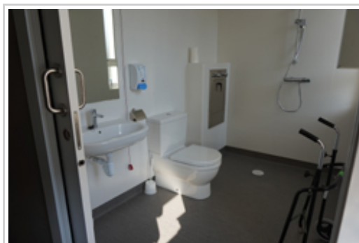
Uno de los baños renovados.

Es una cirugía indicada para pacientes con IMC superior a 40 kg/m 2 mantenido más de 3-5 años, en quienes el tratamiento médico no ha dado resultados satisfactorios tras, al menos, un año de aplicación reglada y con buena adherencia del paciente. También es indicada para pacientes con IMC de entre 35 y 40 kg/m 2 que presenten dos comorbilidades secundarias a la obesidad, que limitan su vida diaria y que son susceptibles de mejorar con la pérdida de peso (síndrome de apnea del sueño, hipertensión arterial, dislipemia, diabetes mellitus, osteoartropatía severa, etc.).