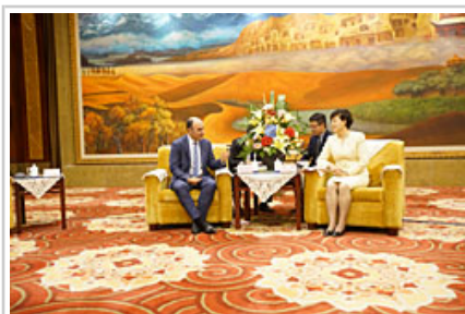
Conversación entre Ayerdi y Wei.