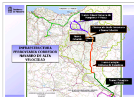
Corredor navarro del Tren de Altas Prestaciones.